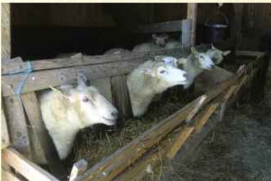
Fra gården på Vidaråsen