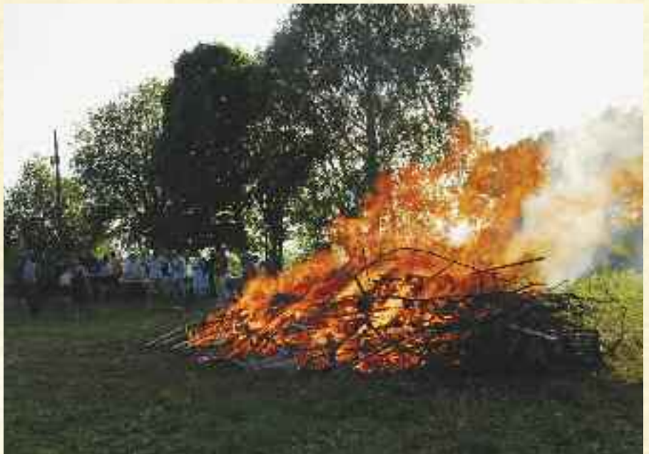
St Hansbål på Solborg.

I vår tid står vi overfor et valg: enten la oss drive med i den felles flod av media og underholdning, eller vi kan forsøke å forme vårt daglige liv mer bevisst. Dessverre er det slik at det meste av det som i dag tilbys, bidrar til å utviske det individuelle. Der vi kan begrense de kollektive påvirkninger, kan noe individuelt komme frem i det nære rom med familie og venner. Våre små bidrag til en be-