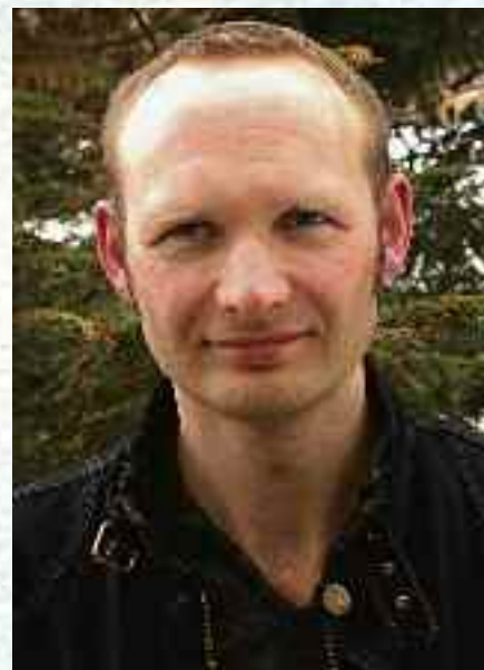
Geir Legreid.

I anledning drøftinger mellom Sosialterapeutisk Forbund og Steinerskoleforbundet om skolens status og kontingenter, utviklet samtalen seg til mulige fremtidsscenarioer.