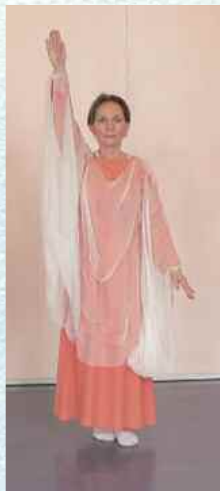
Fra Eurytmihøyskolen i Oslo.

Teksten er basert på informasjonststoff fra Eurytmihøyskolen i Oslo. Red.