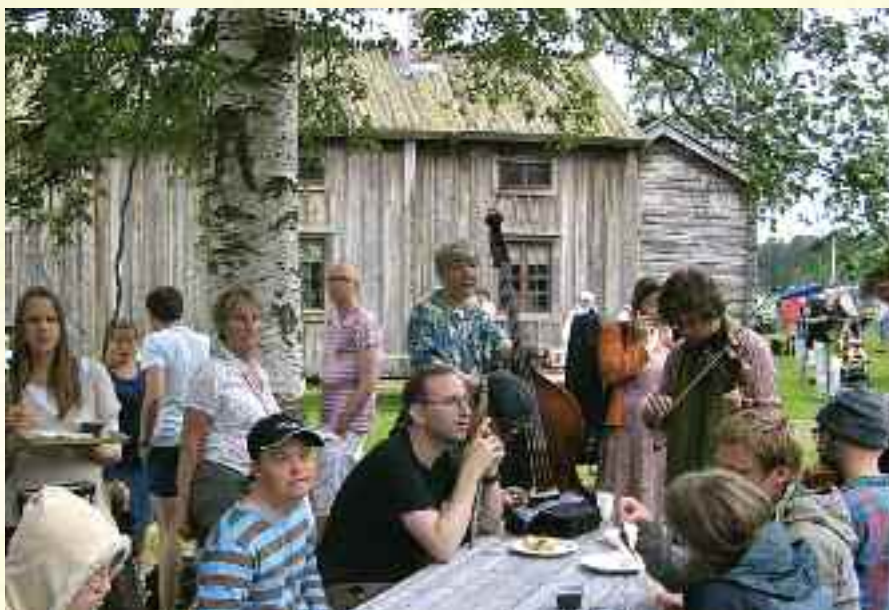
Overalt sitter musikere og spiller sammen eller for hverandre.

"De olympiske Camphill leker" var på programmet. Rett fra høyhustreningen i Mostadmarka dro 10 godt trente trøndere tidlig denne morgen til sportsplassen. Vi trodde først ikke våre øre og øyne men en fullsatt stadion tok oss imot. Og ikke bare svenske eller nordmenn, nei hele