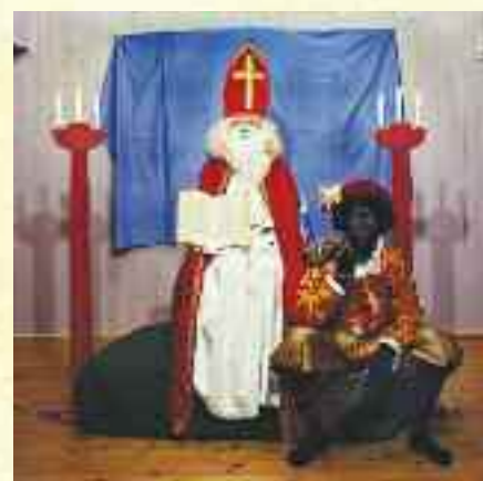
They fairly pour warmth into him

nikken gir arbeidene et særegent uttrykk, som kombinerer elementer fra digital bildeproduksjon med før-fotografiske teknikker. Paul var avbildet på omslaget til siste nummer av Landsbyliv.