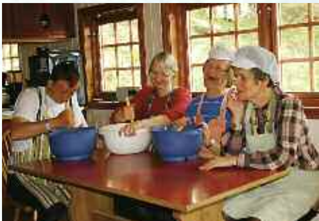
Samarbeid på kjøkkenet, Helgeseter.