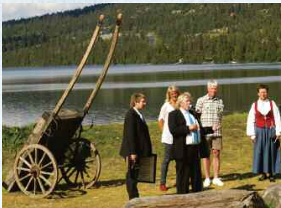
Fra utdelingen av Peer Gynt Prisen 2010.

Igjen er Landsbyliv på Gålå i Gudbrandsdalen. Denne gangen er det ikke for å være med på "Peer for alle-festival", men for å overvære årets Peer Gynt-prisutdeling!