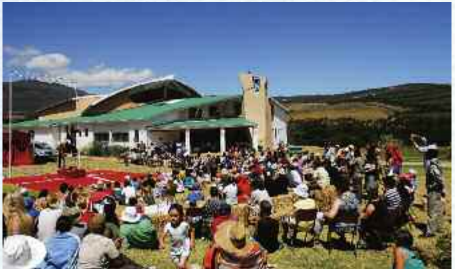
Markedsdag på Camphill

Sirkusartistene skapte stor begeistring hos de flere hundre store og små som var møtt frem. Det ble sjonglert, gjort akrobatiske kunster og hopp gjennom flammer. Spesielt var klovnene populære. Akrobatene avsluttet med å danne en pyramide hvor fire av de små tilskuerbarna ble heist opp i pyramiden. Noen timer senere var det barnas tur til å lage sirkus. De hadde på forhånd fått noen dagers undervisning av "proffene" og lånte