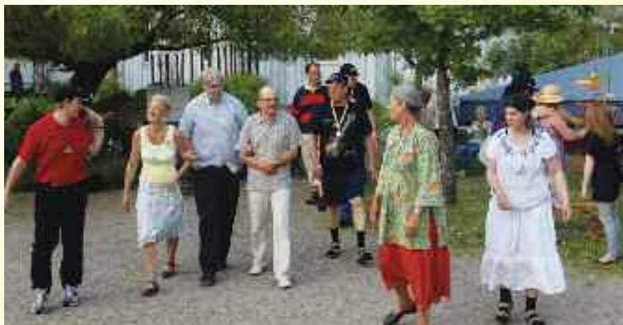
Kveldsstemming på Staffansgården under Delsbofestivalen

På lørdag var det utflukt. Etter frokost møttes alle ved idrettsplassen. Det var flere utflukts tilbud: Å reise til Hudiksvall eller å ro en spesiell type kirkebåt. Det var også mulig å gå på tur eller delta i kunstneriske aktiviteter. Vi fra Vidaråsen ble med en stor gruppe som dro til Jærvzoo, en