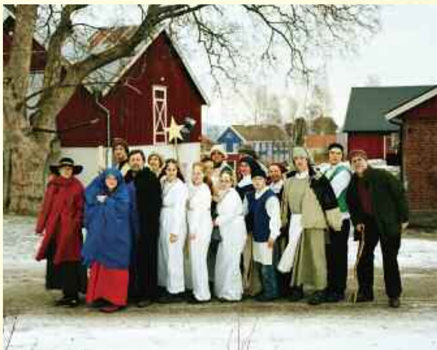
Camphill Rotvoll

Deltagende observasjon er sentralt i Havneraas sin kunstneriske praksis. Havneraas deltar selv i Camphill-landsbyene som aktør i oppsetningene og som betalt arbeider. Dette er minst like viktig for hans praksis som den fysiske produksjonen av kunstverkene.