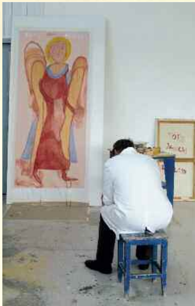
St Mikael, malt av Tore Janicki etter et ikon