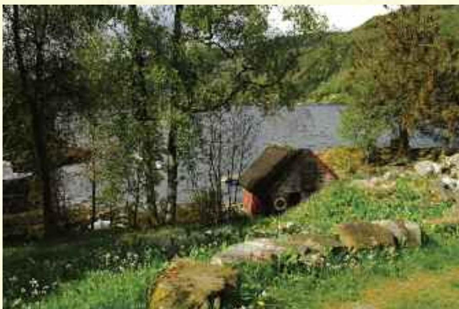
Idyll ved Sørfjorden

Rostadheimen Bo- og arbeidsfelles- skap er et snart 50 år gammelt sam- arbeidsprosjekt hvor alle på stedet er viktige medspillere.