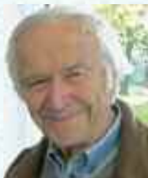
Nils Christie