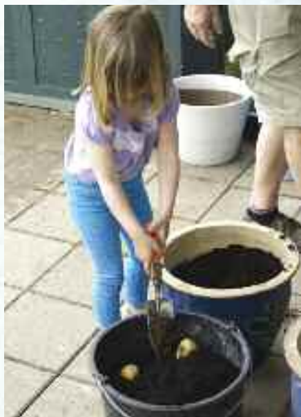
Setting og innhøsting av poteter.