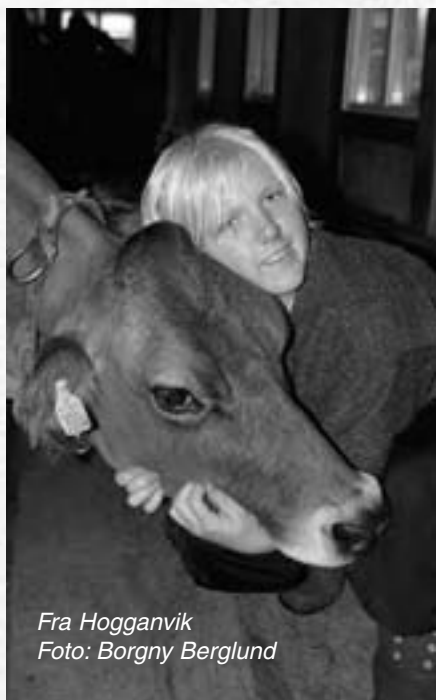
Fra Hogganvik

Det finnes over 100 Camphill-landsbyer og -skoler fordelt på flere kontinenter. De fleste ligger i Europa og Nord-Amerika, men det er også landsbyer i drift i Afrika, samt noen