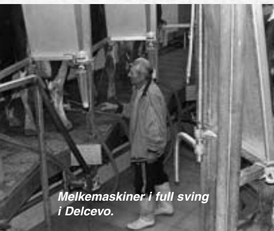
Melkemaskiner i full sving i Delcevo.