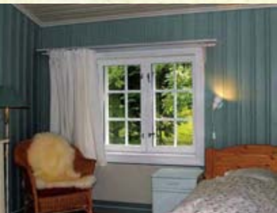
Fra Framskolen.

Er økologiske vaskemidler mindre virksomme enn de vanlige?