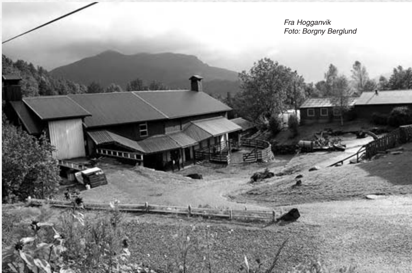
Fra Hogganvik

En levende og menneskevennlig arkitektur preger landsbyene. Husene er moderne utstyrt, og det er lagt vekt på fargevalg og materialkvalitet i innredningen. Det finnes hus i ulike størrelser, fra små én-familie-hus til storhusholdninger med plass til 10-12 mennesker. Egen hybel kan også tilbys.