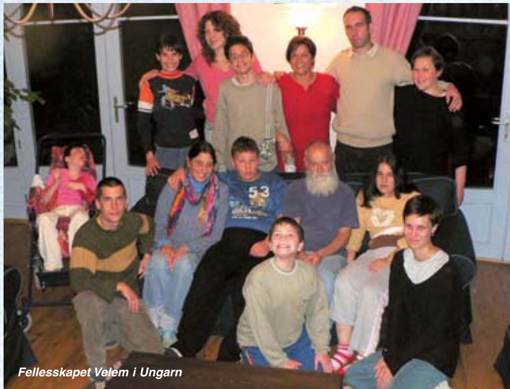
Fellesskapet Velem i Ungarn