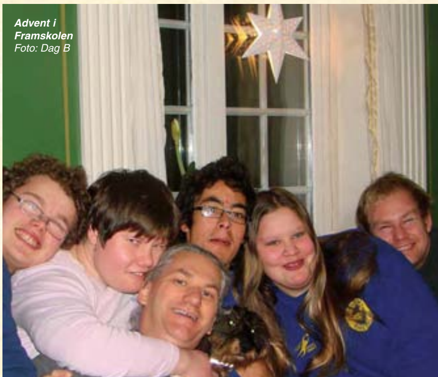
Advent i Framskolen