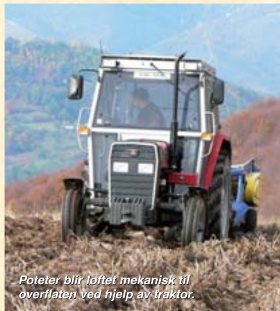
Poteter blir løftet mekanisk til overflaten ved hjelp av traktor.

Goran Vuckovski har en visjon med utgangspunkt i melkeproduksjon.