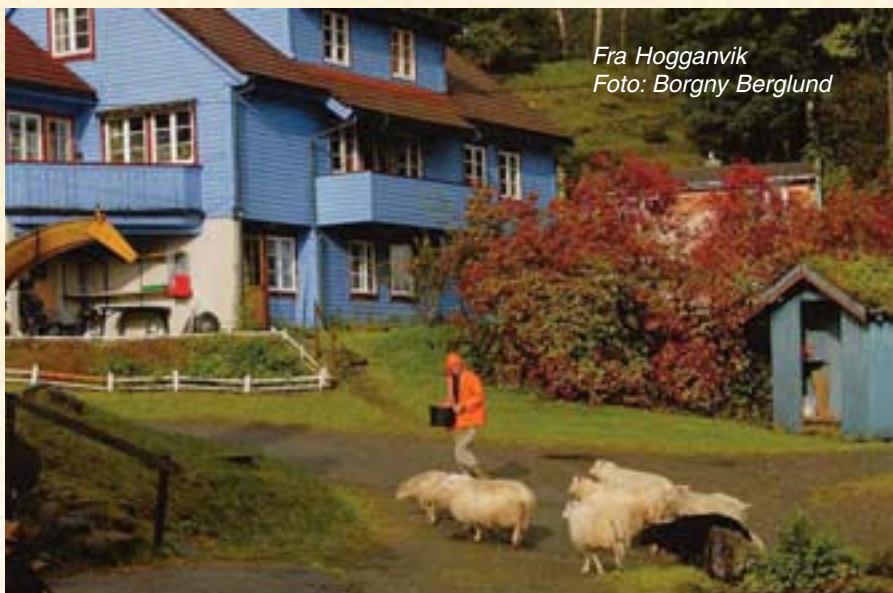
Fra Hogganvik