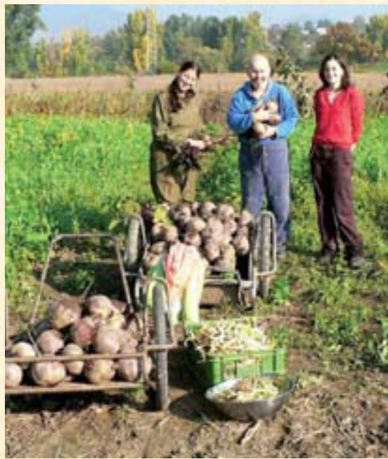
Markens grøde, grønnsaker for salg fra jordbruket på stedet