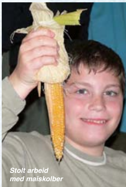
Stolt arbeid med maiskolber

I løpet av de siste 7 år har gruppen vært på besøk ved flere Camphill-